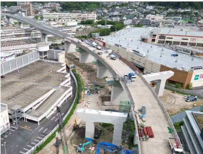
③ 令和 4 年度広島高速 5 号線温品 JCT 下部工事