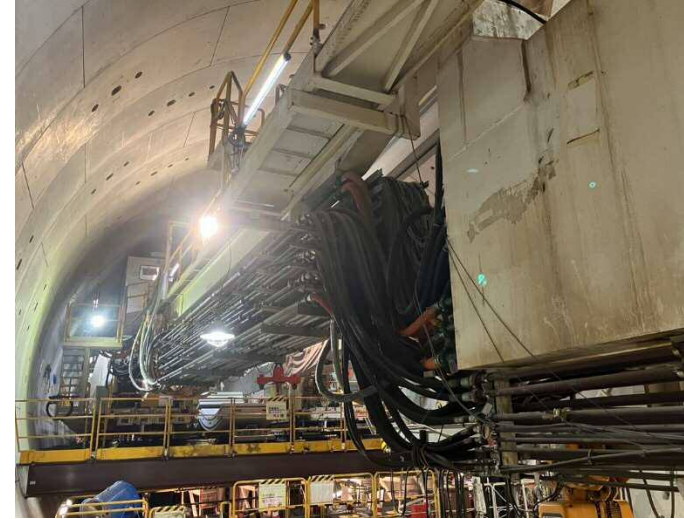
② 高速 5 号線シールドトンネル掘削他工事