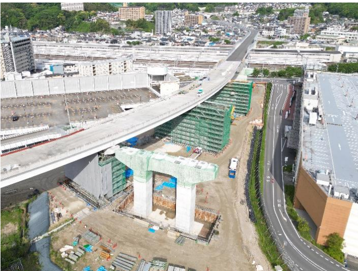
③ 令和 4 年度広島高速 5 号線温品 JCT 下部工事