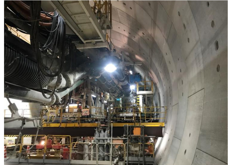
② 高速 5 号線シールドトンネル掘削他工事