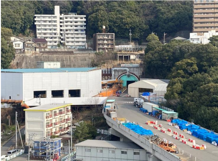
① 高速 5 号線シールドトンネル掘削他工事