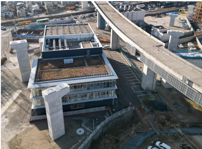
③ 広島高速 5 号線温品 JCT 下部工事 (1 工区)