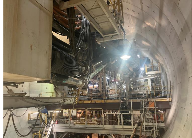
② 高速 5 号線シールドトンネル掘削他工事