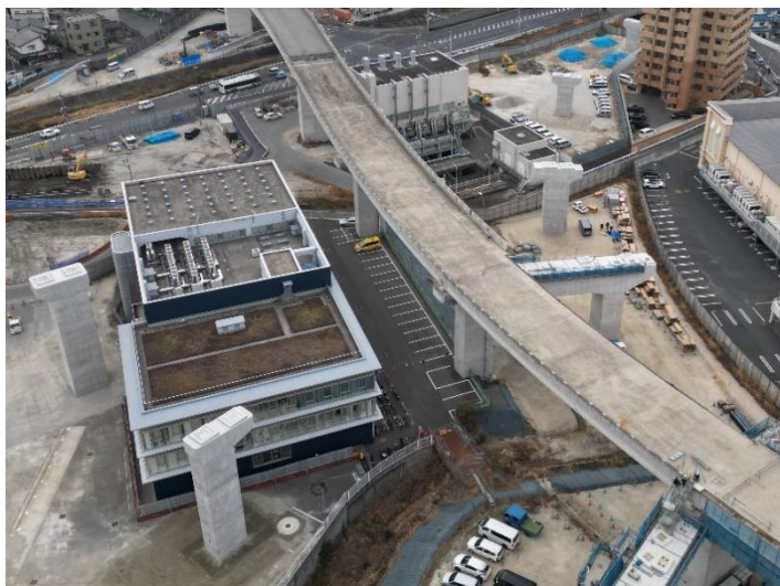
③ 広島高速 5 号線温品 JCT 下部工事 (1 工区)