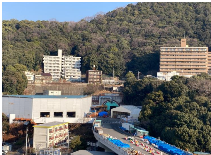
① 高速 5 号線シールドトンネル掘削他工事