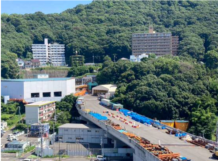
① 高速 5 号線シールドトンネル掘削他工事