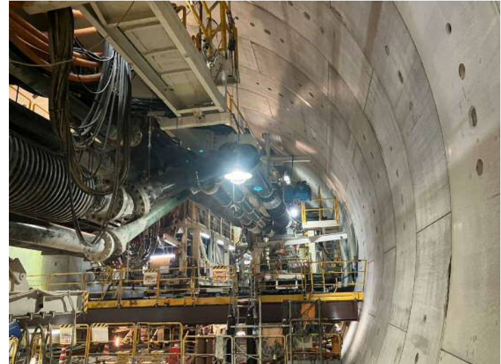
② 高速 5 号線シールドトンネル掘削他工事