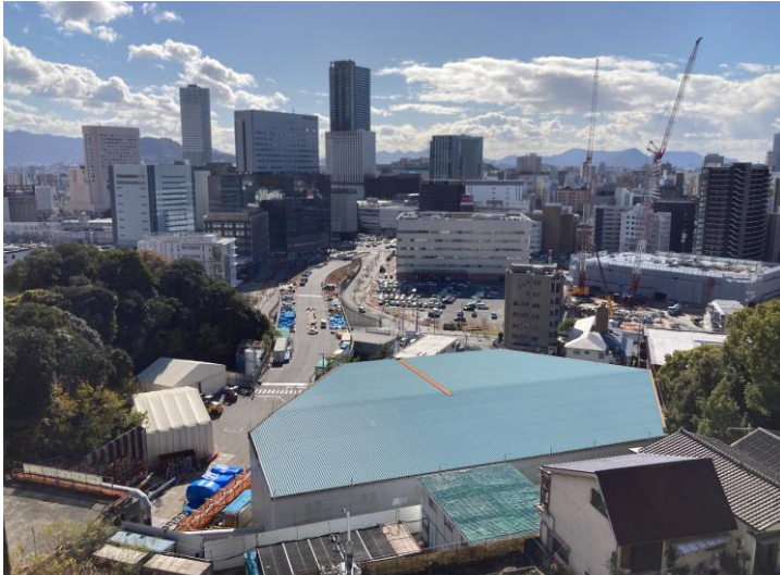
① 高速 5 号線シールドトンネル掘削他工事