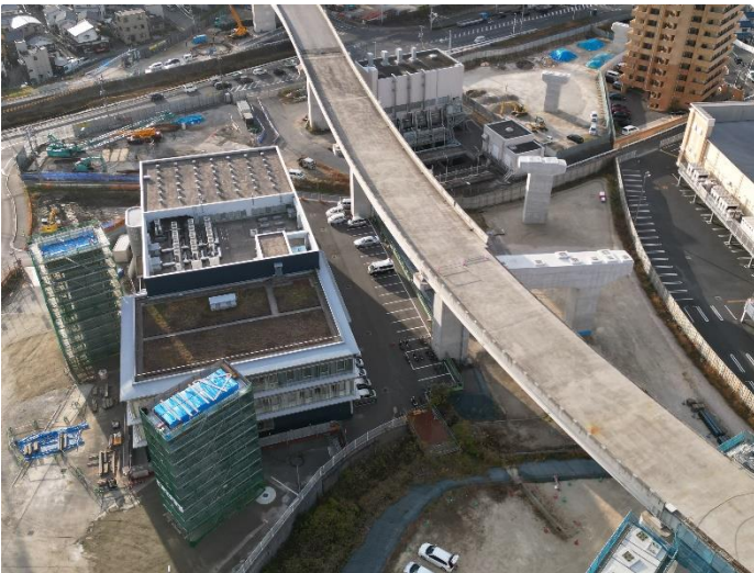
③ 広島高速 5 号線温品 JCT 下部工事 (1 工区)