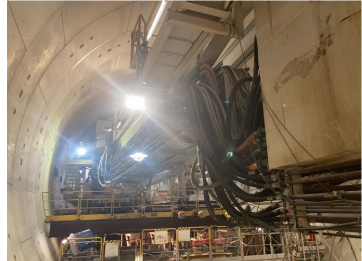
② 高速 5 号線シールドトンネル掘削他工事