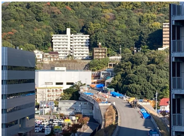
① 高速 5 号線シールドトンネル掘削他工事