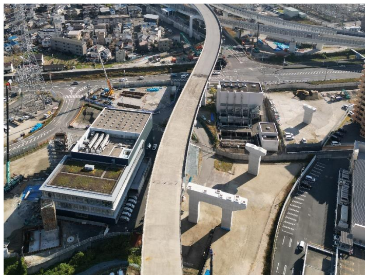
③ 広島高速 5 号線温品 JCT 下部工事 (1 工区)