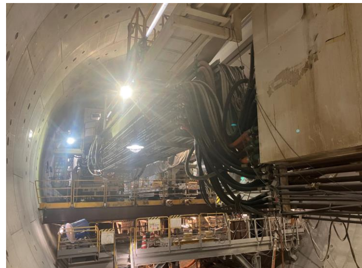
② 高速 5 号線シールドトンネル掘削他工事