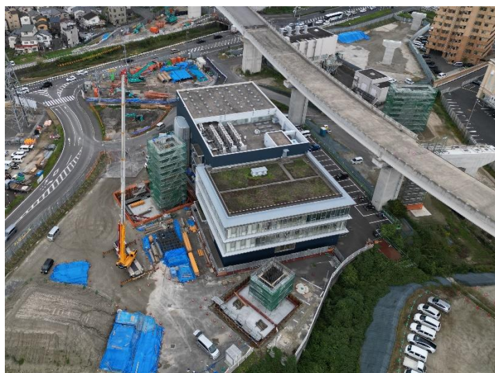
③ 広島高速 5 号線温品 JCT 下部工事 (1 工区)